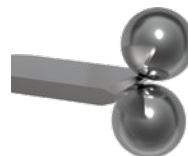
Version V4 Ø 8 mm